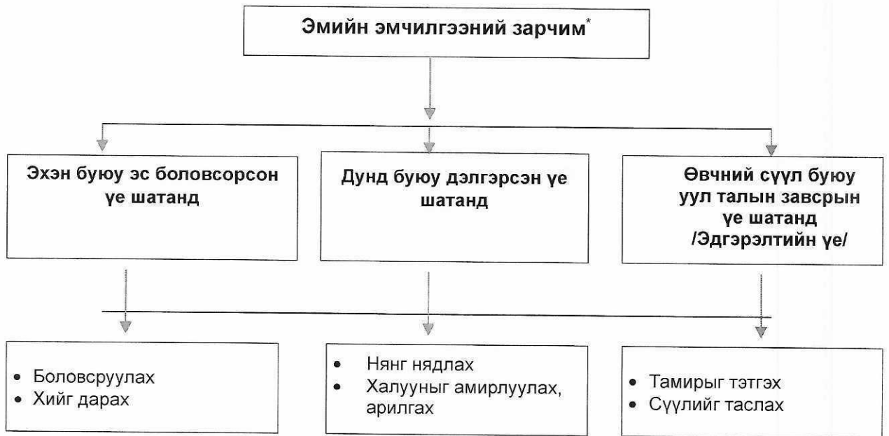
Хүснэгт 6. Эмийн эмчилгээг өвчний үе шаттай уялдуулах